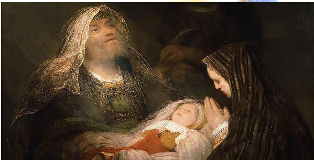
Siméon et Anne. Arent de Gelder

A l'entrée du Temple, Marie et Joseph vont être saisis par la présence et la réaction de deux personnages. On aurait pu les imaginer accueillis par une foule, ou un grand prêtre, mais ce n'est pas ce que nous raconte Luc. Il nous parle de deux personnes âgées. L'un est Syméon : Il avait reçu de l'Esprit Saint l'annonce qu'il ne verrait pas la mort avant d'avoir vu le Christ, le Messie du Seigneur. On le voit, mu par l'Esprit, prendre l'enfant, bénir la famille, prophétiser, louer le Seigneur ! Et il y a Anne : une femme prophète, très avancée en âge. Elle aussi proclame les louanges de Dieu. Tous deux reconnaissent Jésus ! Tous deux peuvent maintenant mourir en paix, car leur vie sur terre prend sens, et pour chaque génération après eux : « D'âge en âge, Seigneur, tu as été notre refuge. » Ps 89,1 Une rencontre admirable de foi et de vérité, qui relie Jésus à l'histoire de son peuple, et signe l'accomplissement de la promesse, le Salut annoncé.