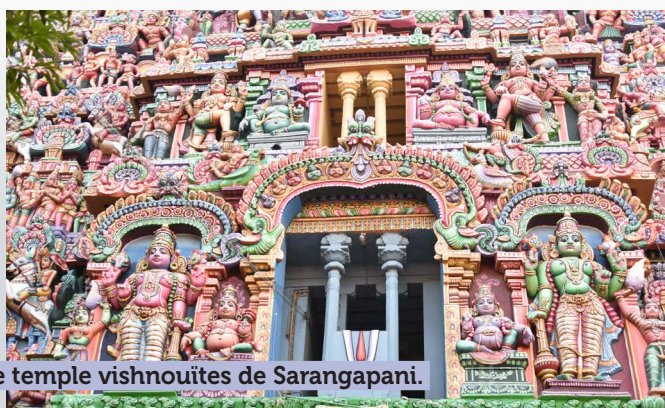
Le temple vishnouïte de Sarangapani.

Dîner et nuit dans les environs de Kumbakonam à Swamimalai (9 km).