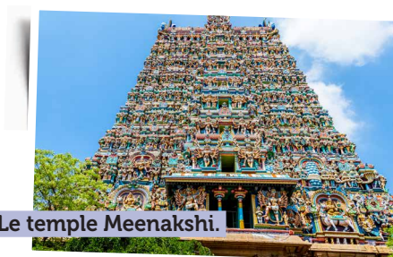
Le temple Meenakshi.

Le matin, découverte de Madurai , « la ville des temples de l'Inde du Sud », centre d'apprentissage et de pèlerinage depuis des siècles. Ce bastion de la culture tamoule abrite le temple de Minashki-Sundareshvara , véritable labyrinthe de cours et de halls. En face du temple, visite de l'ancienne salle d'audience du roi.