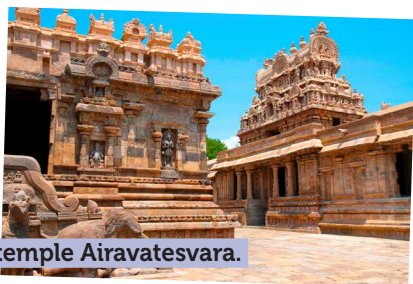
Le temple Airavatesvara.

Le matin, messe au sanctuaire de Velankanni.