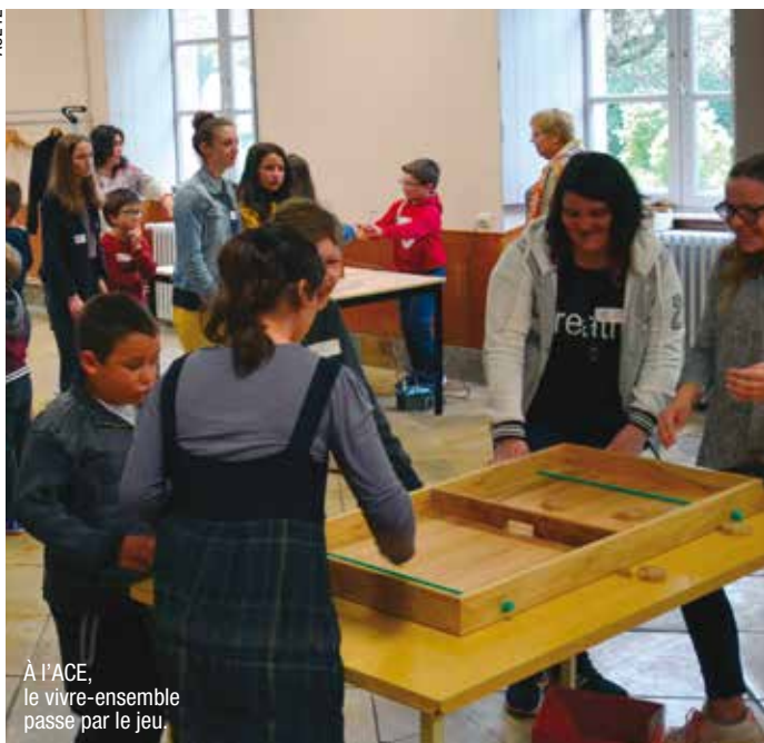
À l'ACE, le vivre-ensemble passe par le jeu.

le matin ne faisaient que composer le refrain de la chanson. Chaque note associée à une autre offre de multiple combinaison et c'est comme cela que tout au long de la journée nous avons été « + fort(s) ensemble ». À suivre... ■