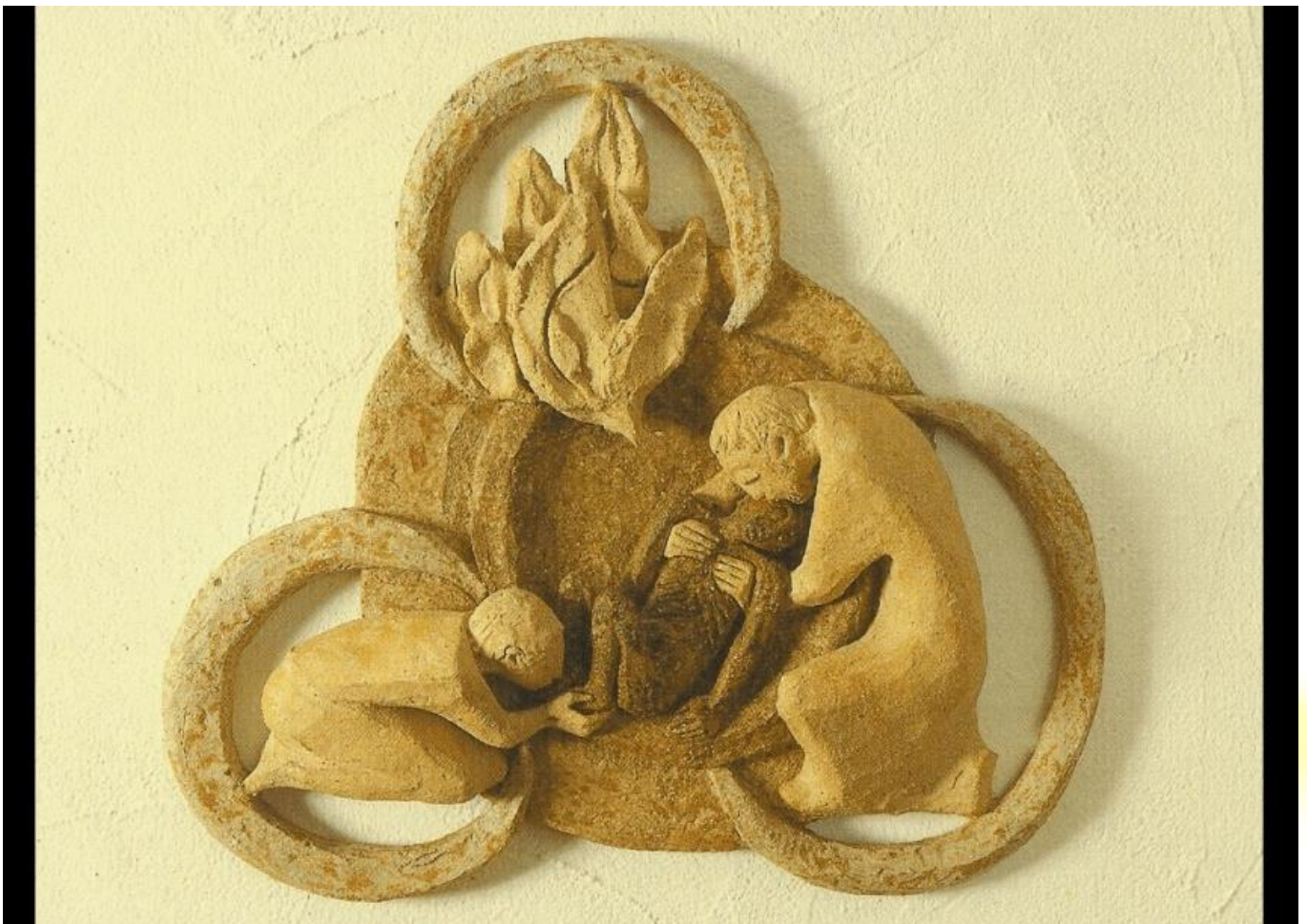
Céramique de Sœur Caritas Müller