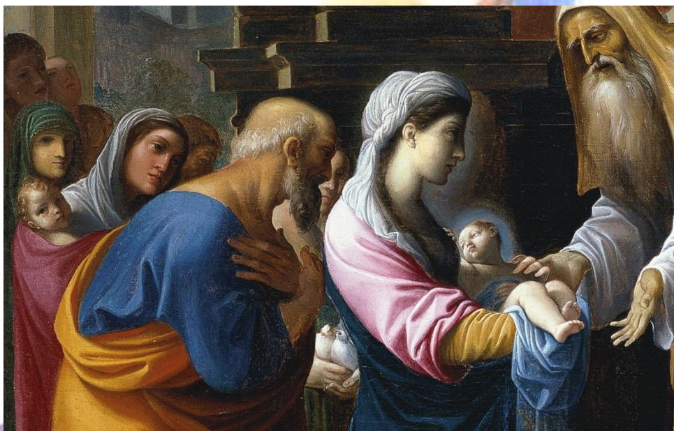
Présentation de Jésus au Temple - Ludovico Carracci (détail)

La Sainte Famille est bien là dans sa pauvreté, sa simplicité, son humilité. Mais elle est infiniment riche du don de Dieu, du don de l'Amour, qui donne à l'enfant de grandir et de se fortifier, rempli de sagesse et de la grâce de Dieu.