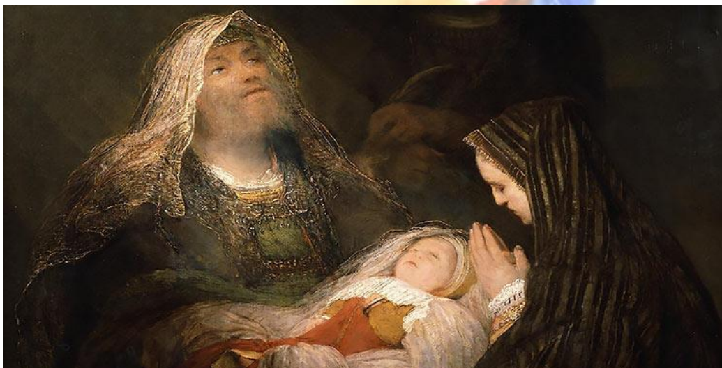
Siméon et Anne. Arent de Gelder

Une rencontre admirable de foi et de vérité, qui relie Jésus à l'histoire de son peuple, et signe l'accomplissement de la promesse, le Salut annoncé.