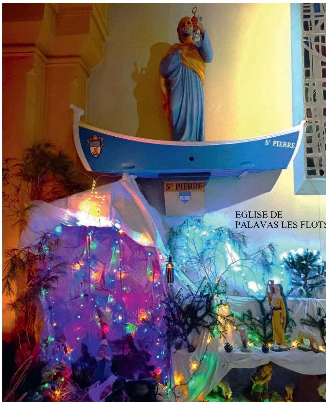
EGLISE DE PALAVAS LES FLOTS