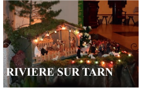
RIVIERE SUR TARN