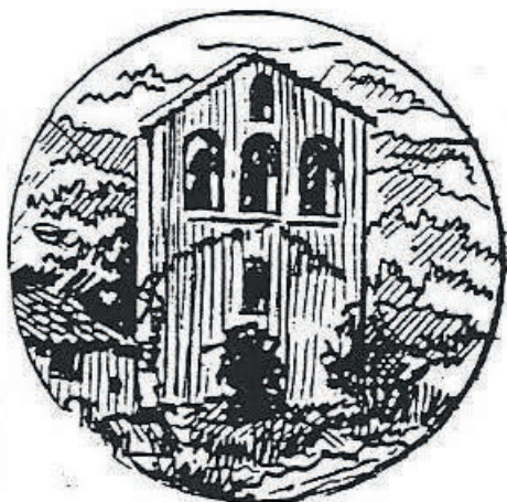
Chapelle Saint Segond