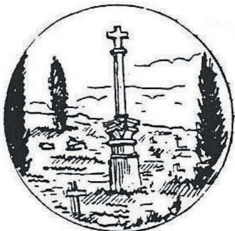
Notre Dame de Lumenzon