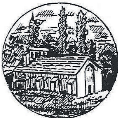
Notre Dame des Champs