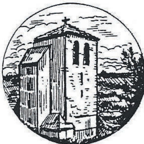
Saint Jean de Balme