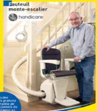
Sauteuil monte-escalier handicapé

Études et devis gratuits La garantie des professionnels de l'installation au Service Après-vente !