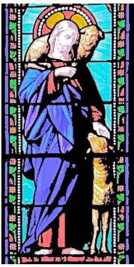
Vitrail St Etienne de Naucoules